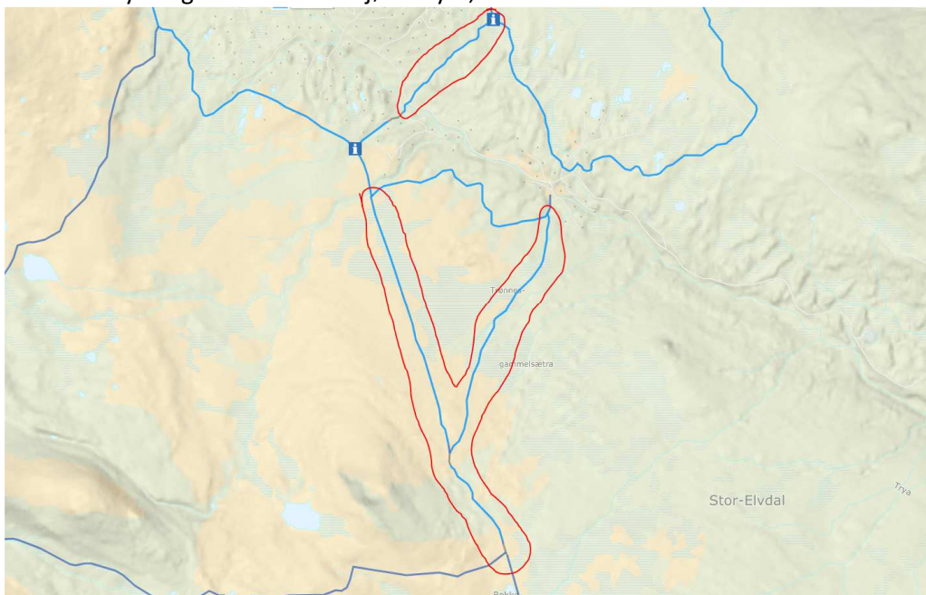
Stolper utkjørt Gardåa-Løypekryss Skramsvoldalen/Tittelsjøen-Trønnes Gammelsæter