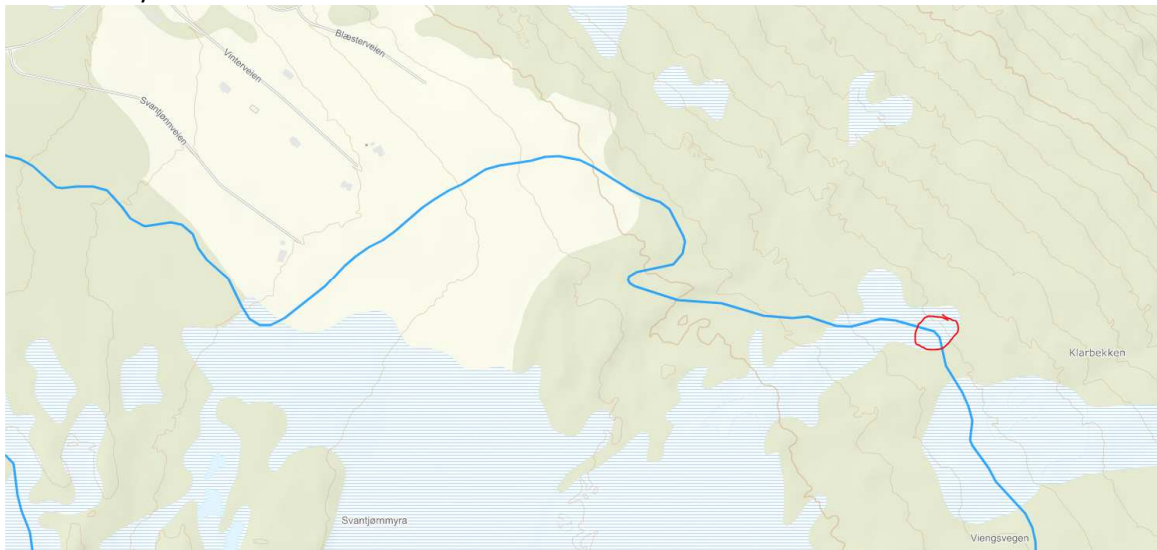
Bru over myrdrag nedenfor Svantjønnsmyra, Blakersmorunden